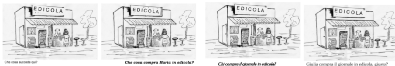
FIGURE 1 – Stimuli de la version italienne de la tâche.

phrase de référence. Ensuite, on passe aux diapositives suivantes, qui contiennent les mêmes images, accompagnées de différentes questions écrites. Des exemples de la version italienne sont illustrés à la page suivante, dans la Figure 1.