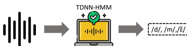
FIGURE 1 – Système de détection de schwas de référence

Nous utilisons ainsi la sortie en mots de ce système complet de RAP que nous transcrivons ensuite en unités phonétiques en utilisant le Lexique 3.83 (voir la Figure 2). Si un mot n’est pas inclus dans celui-ci, nous l’avons transcrit manuellement. Le nombre d’occurrences détecté de /ə/, /ø/, et /œ/ est ensuite extrait de cette transcription. Cette méthode permet d’associer l’audio à la prononciation standard, ce qui réduirait la différence dans les transcriptions entre le lexique du système complet RAP et le lexique 3.83. Par exemple, le lexique à l’intérieur du système transcrivait le mot « premier » comme /pʁɛmjɛ/ alors que la prononciation standard dans le Lexique 3.83 est /pʁɔmjɛ/.