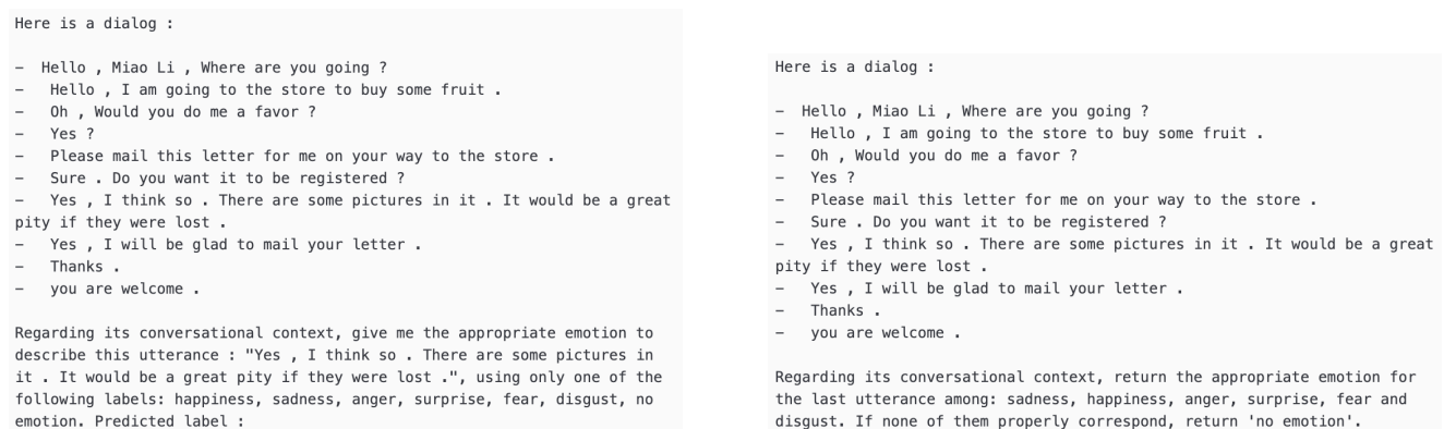
(a) Requête utilisée pour Llama2

Comparaison avec les LLMs. Afin de mettre en perspective les résultats de nos modèles isolés et contextuels, nous comparons nos modèles avec des LLMs état-de-l’art, à savoir LLaMA 2 (Touvron et al. , 2023) et Falcon (Penedo et al. , 2023). Les deux sont considérés dans leur version adaptée aux instructions ( instruction fine-tuning ) et évalués en génération sur un seul essai ( zero-shot ). Nous avons développé une requête ( cf. fig. 2, prompt en anglais) demandant une prédiction sur le dernier énoncé de chaque dialogue du jeu de test de DailyDialog. Les requêtes sont conçues de sorte à ce que le modèle ne génère qu’une seule étiquette. La requête est la même pour chaque modèle du même type (LLaMA ou Falcon). Il est difficile de trouver une bonne requête pour Falcon car le modèle génère happiness (joie) sur l’ensemble des données, à l’exception d’un dialogue.